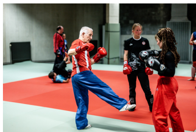
zich inschrijven bij een lokale sportclub