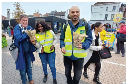
als vrijwilliger meewerken bij een evenement of in een vereniging