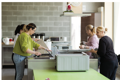
een kennismakingsstage doen bij een bedrijf

activiteiten over heel Vlaanderen en Brussel die passen in het participatietraject. Je kan onder meer filteren op locatie, interesse en doelstelling. Organisaties en bedrijven kunnen heel gemakkelijk hun aanbod toevoegen. Staat jouw activiteit er al op?